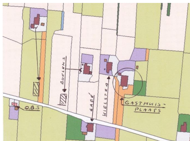
De Gasthuisplaats op kadasterkaart 1832:

Uit de Encyclopedie van Friesland het volgende: Het St. Anthony Gasthuis te Leeuwarden heeft vele bezittingen ("gasthuis plaatsen" soms met bel in de gevelsteen). Oorspronkelijk was het armen ziekenhuis, maar ook reeds vroeg proveniers- of kostkopershuis.